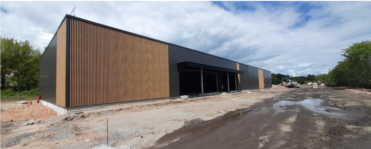
Travaux en cours